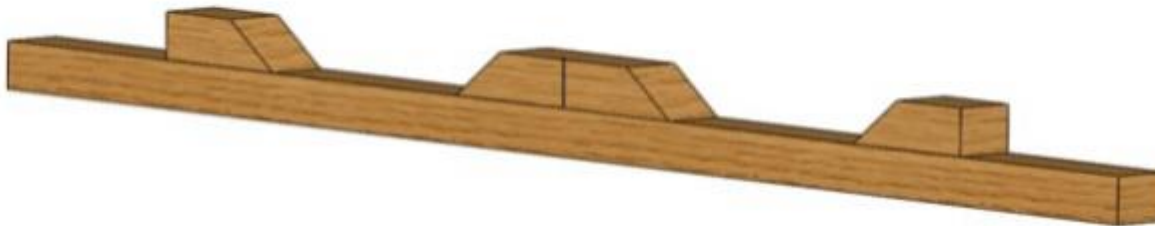
Cuartón base (1)