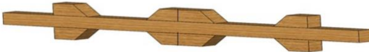
Cuartón Intermedio (2)